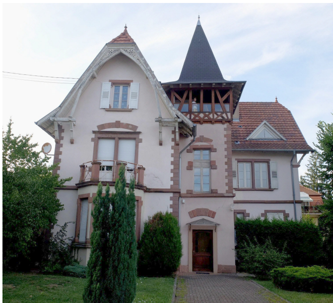
Une villa du Millioneviertel de Haguenau.