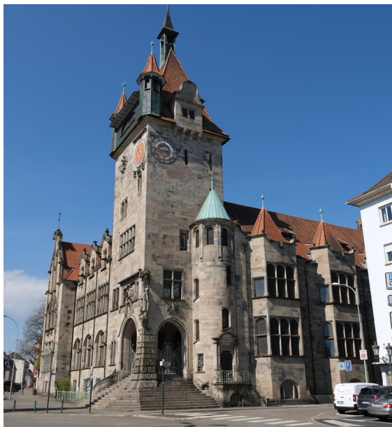
Le Musée historique de Haguenau.