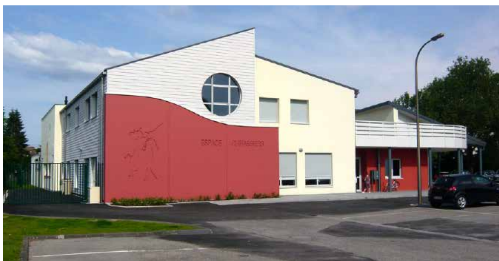
Espace Cuirassiers, place de la Castine, à Reichshoffen.